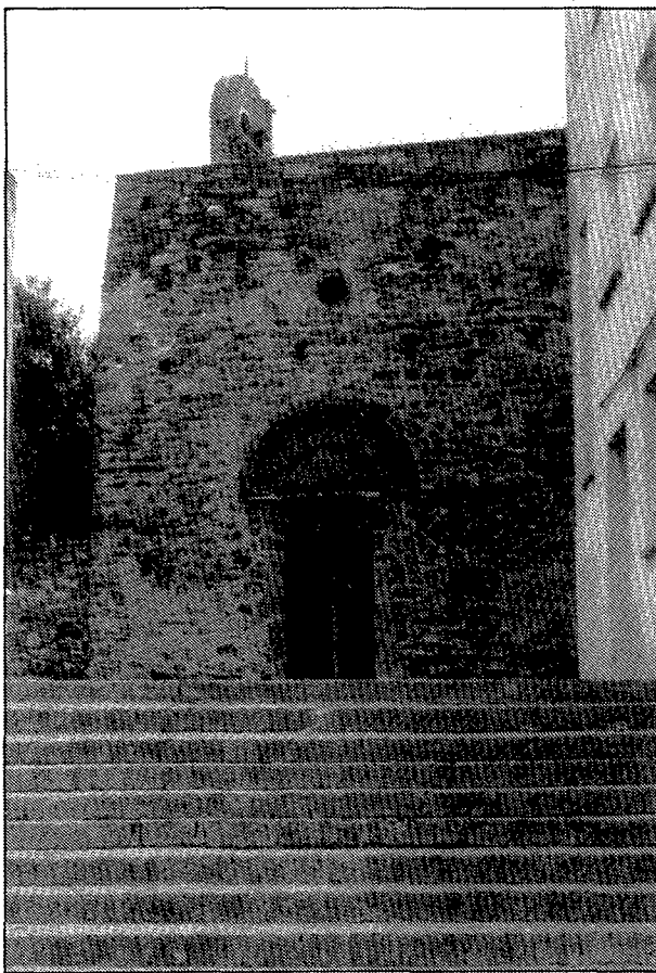
Aspecte exterior de l'església de Vilajuïga.