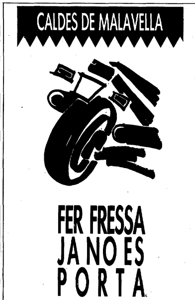
Les dues campanyes es van fer amb els lemes «Fer fressa ja no es porta» i «Juguem net».