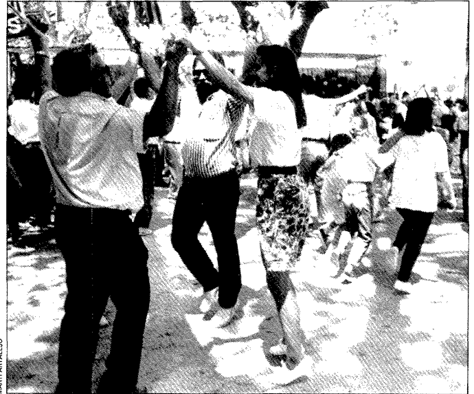
La fotografia recull un moment de les audicions de la tarda.