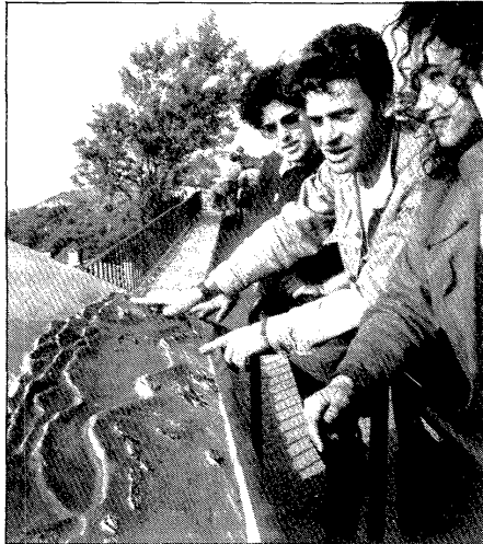
Un jove assenyalava una localització en un dels murals.

dides. També cal destacar que durant tot el dia va estar exposat el banderí de la colla sardanista Joventut i Alegria, de l'any 1949, que ha pogut ser recuperat aquest any.