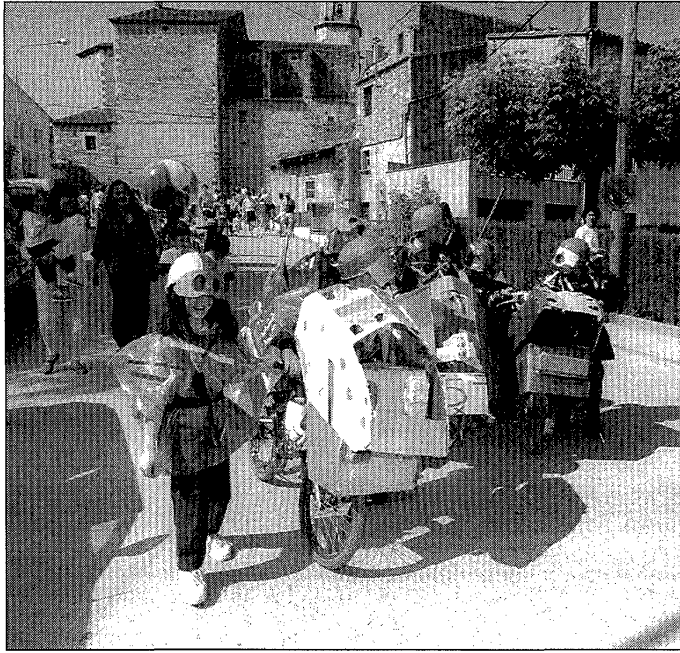
La Desfilada de Coses amb Rodes va ser un dels actes més vistosos de la festa.