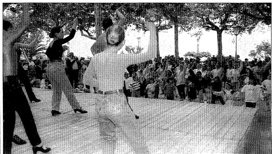
La marató va ser seguida per unes cinc-cents persones.

d'una amanida de foie-gras d'ànec amb favetes i espàrrecs verds. A continuació, es va oferir un primer plat de llobarro rostit a la cassola amb cebetes i gambes i un segon plat de colomí cuit en dos temps i en el seu suc. Finalment, les postres van consistir en un crocant de fruites roges.