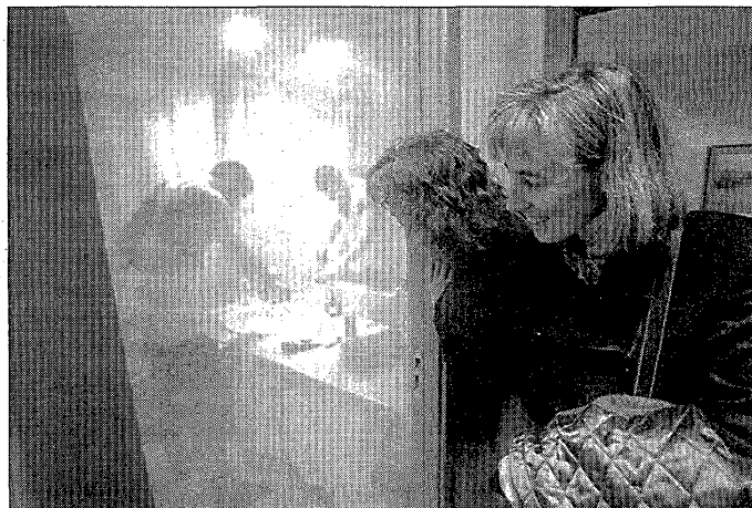
A dalt, el cavall blanc que donava la benvinguda als assistents. A baix, dues noies miren com un jove es vesteix després de dutxar-se en una de les habitacions de l'hotel.

La part gastronòmica va comptar amb aperitius, bufet i un menú configurat a base de cuina catalana antiga —sopa de carbassó i de farigola, coca de pagès i de recapte, cuixa de xai farcida, garrí farcit i oca rostida— i d'especialitats del famós xef Jean-Paul Vinay, artífex que el Bulli, de Ro-