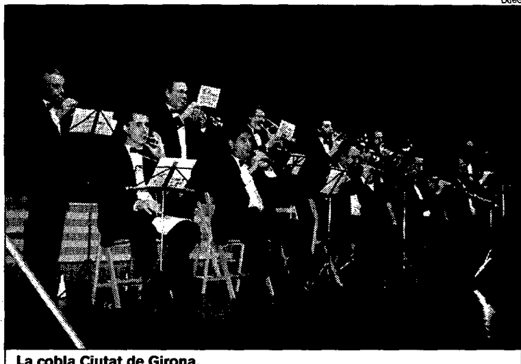
La còbala Ciutat de Girona.

Amb la participació de quatre cobles, Ciutat de Girona, Marinada, Mediterrània i Mil·lenària, l'aplec se celebrarà seguint el caire habitual en tres sessions: matí, tarda i nit. Del total de les 37 composicions programades, quatre seran interpretades de conjunt per les cobles participants: Gent de Malgrat , de Martirià Font; Aplec d'aplec , del cassanenc Francesc Camps; Caldes Aplec d'Or , una estrena original de Lluís Albert, i Poble de Cal-