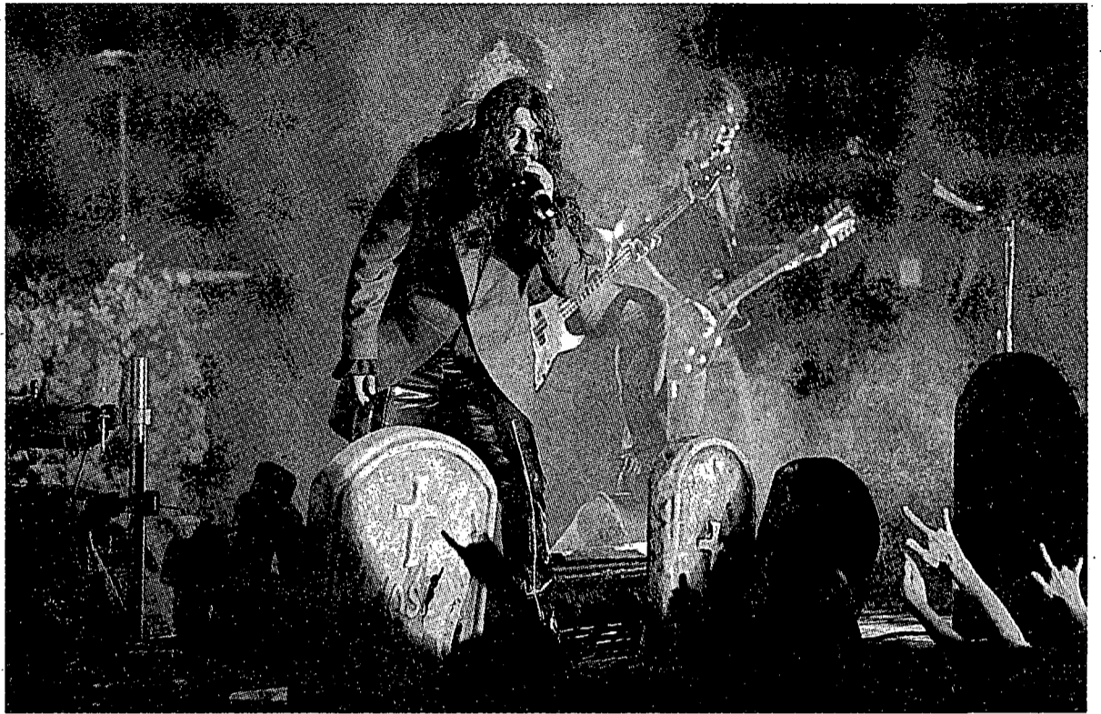
Una imatge de l'escenari dels Mago de Oz en el concert de dissabte a la nit a Fontajau.