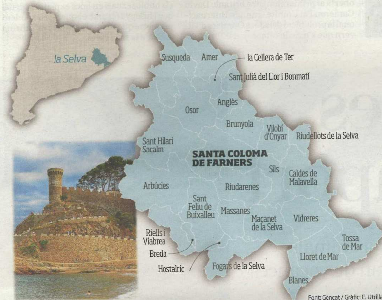
Font: Gencat / Gràfic: E. Utrilla

LES DADES Comarca litoral de la Costa Brava que entra en contacte amb els massissos del Montseny i les Guilleries. Té un total de 173.518 habitants, repartits en 26 municipis. Santa Coloma de Farners n'és la capital. Hi ha 12.710 aturats i 37.493 immigrants.