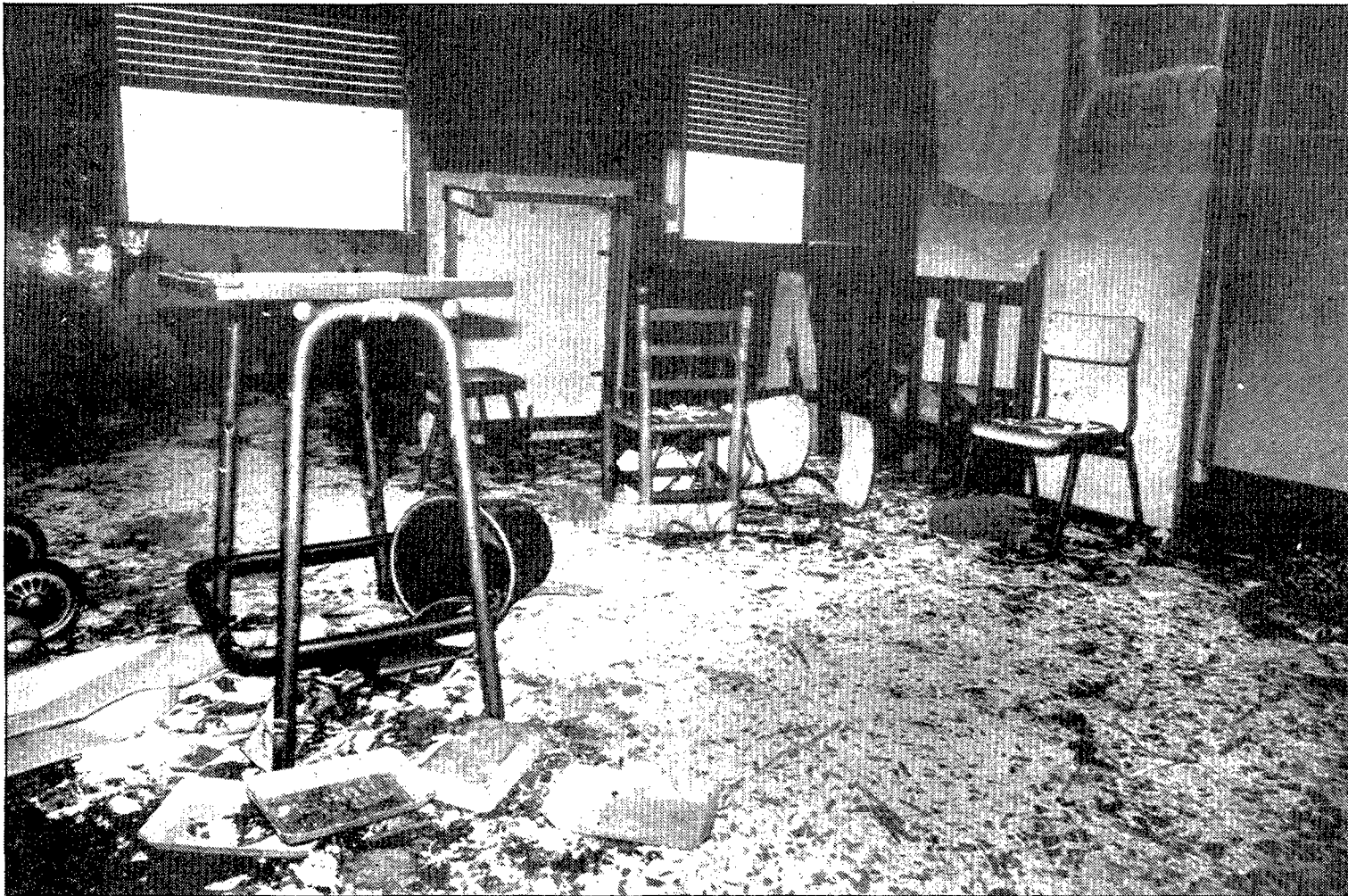
Aspecte de la guarderia de Riudarenes després del foc.