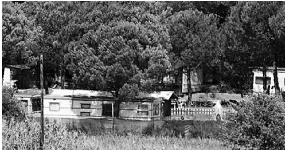
Algunes de les rulots acampades, a finals d'agost.