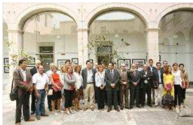
Els representants dels ajuntaments signants del conveni, la Diputació i l'Agència de Protecció de la Salut. aniol resclos

L'amenaça del mosquit tigre ha fet reaccionar 32 ajuntaments de Girona, que ahir van signar un conveni per lluitar contra la implantació d'aquest insecte a la demarcació. D'aquesta manera, els consistoris s'han sumat a una iniciativa de l'Organisme autònom de Salut pública de la Diputació (Dipsalut) i la Mancomunitat del Servei de control de mosquits de la badia de Roses i el Baix Ter. L'acord inclou mesures preventives i d'acció davant focus primerencs però, tal com va reconèixer el president de Dipsalut, no ha planificat actuacions per si la presència del mosquit tigre es descontrola.