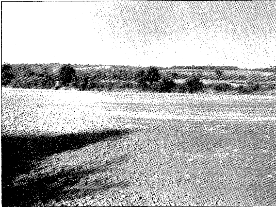
Vista d'una part dels terrenys que ocuparà el futur camp de golf de Caldes.

Segons el pla parcial aprovat, hi haurà un total de 1.150 places d'aparcament repartides en diferents sectors, un d'ells de 800 places. Els promotors només preveuen aprofitar una de les tres masies que hi ha a la zona —Can Pau Cuní—, ja que les altres dues estan en mal estat de conservació. Dins les dues-cents cinquanta hectàrees d'extensió del complex, hi haurà un equipament hotelier per a quatre-centes persones que serà gestionat per una empresa multinacional. L'hotel, que es projecta de molt poca alçada però de gran extensió, està emplaçat en una parcel·la d'aproximadament quatre hectàrees. A la zona nord del complex hi haurà, a part de l'aparcament, un edifici que s'utilitzarà com a club de jugadors i una àrea recreativa que ocuparà 6,35 hectàrees. L'impacte ecològic que inevitablement produirà la construcció del golf es compensarà, segons un estudi d'impacte inclòs en