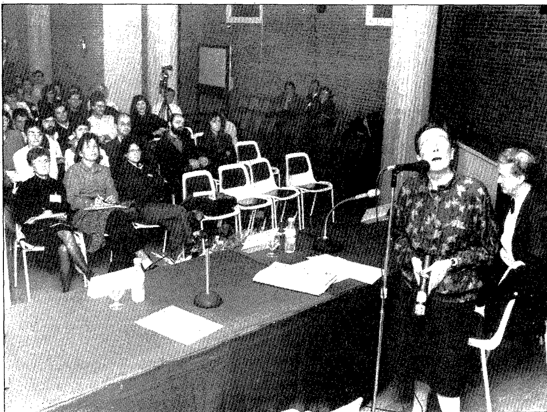
Un moment de la jornada d'ahir del congrés, que se celebra a Girona.