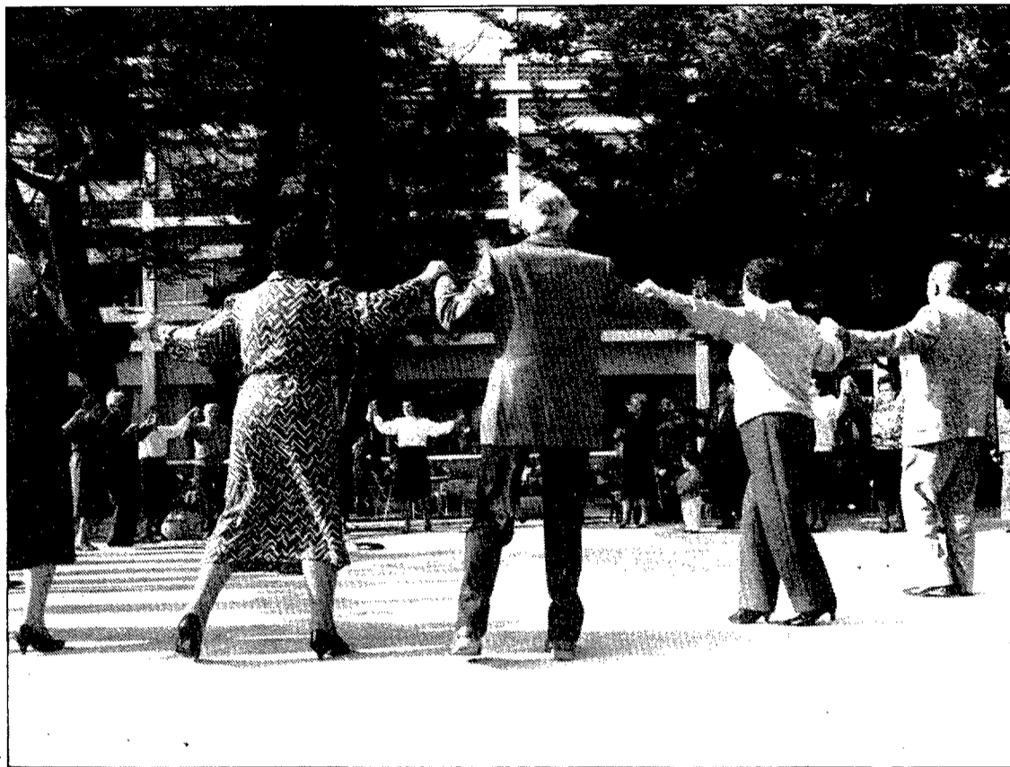
Aquest any els sardanistes no hauran de pagar.

«L'Agrupació s'encarrega —ens continua dient la nostra