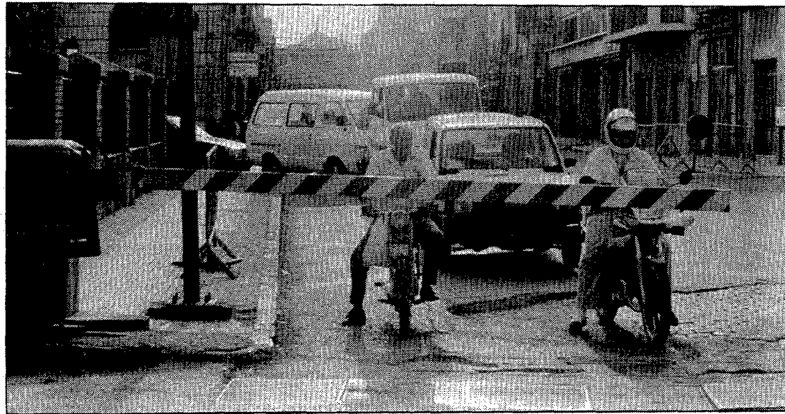
Segons Renfe, la solució definitiva del pas nivell de Figueres, no passa per soterrar la via.

L'alcaldia figuerenca ha sol·licitat mitjançant una carta la cessió o venda dels terrenys propietat de Renfe que s'estenen paral·lels a la via en direcció a Barcelona. La intenció de l'equip de govern és de poder obrir en aquest sector un carrer com a perllongació del passeig Rubaudonadeu, o carrer de l'estació, que permetria la comunicació des d'aquest carrer fins a l'entrada de Figueres, a l'altura de l'hotel Rally. Aquest vial es preveu en el Pla General, on comença a la plaça de l'Estació i arriba a una plaça de nova creació a la urbanització que s'està fent a les antigues instal·lacions de la fabrica d'olis Solpe. Amb la consecució d'aquesta via, el trànsit provinent de Roses tindria un camí de sortida