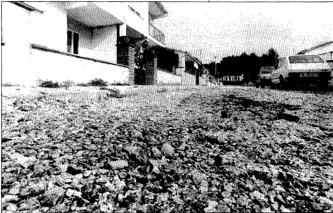
L'Audiència Territorial dona la raó a l'Ajuntament de Caldes i obliga el Patronat a urbanitzar el sector Canigó , a la foto.

El 14 d'octubre del 1986, l'Ajuntament de Caldes de Malavella ordenà al Patronat de l'Habitatge que fes diferents obres a la urbanització. En un informe tècnic sobre la infraestructura, s'assenyalava que s'havia constatat «un deteriorament del paviment i bona part de les voreres aixafades». En el mateix informe sobre les necessitats s'assenyalava que hi havia «trams d'asfalt més mal executats que d'altres i alguns d'enfonsats, a més de clapes en el paviment». Segons l'Ajuntament, la urbanització no tenia els embornals nets i en bon