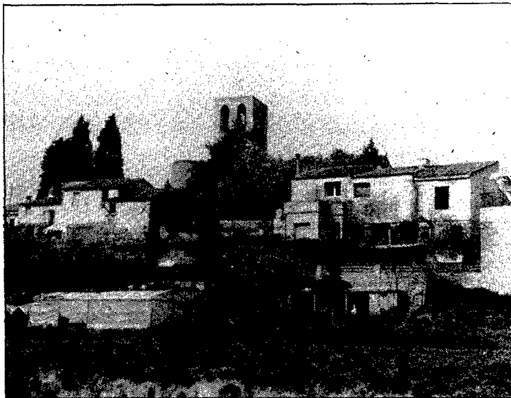
Sant Genís de Palafolls es veuria afectat pel traçat de la variant de la N-II.

En la reunió de dissabte passat, els propietaris afectats per