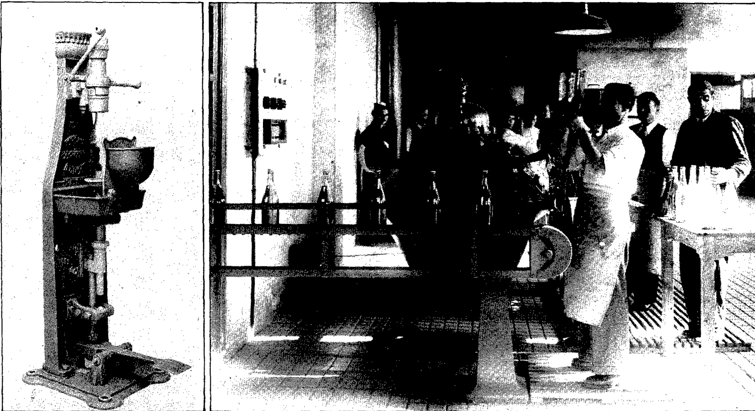
Una màquina d'omplir i tapar és la imatge que il·lustra el cartell i el catàleg que anuncien l'exposició «Caldes de Malavella: Manantial de Catalunya». A la dreta, un embotellament manual, a l'Aigua Malavella.

Una ampolla inflable de sis metres serveix de reclam