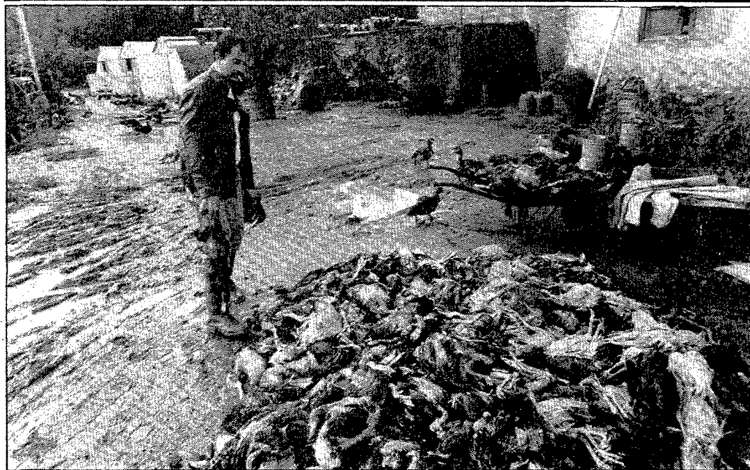
Cent quilòmetres de canals de la Muga van quedar destrossats i els ànecs del Cal Queco de Colomers van morir ofegats.