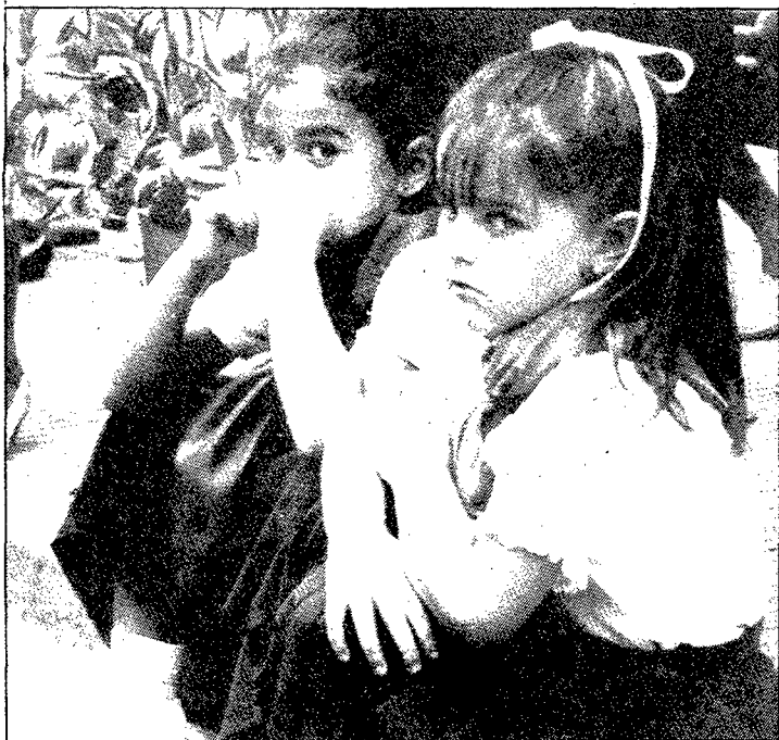
Instantània presa al Memorial Mas i Ros per Esteve Aymerich, i que ha servit de portada al programa de l'Aplec d'enguany.

A més d'organitzar aquestes periòdiques audicions, l'Agrupació es preocupa de promoure a Sils la sardana entre els petits. Així, aquest any s'han acomplert els divuit anys de cursets de sardanes, divuit cursets per ensenyar a Sils l'ordre i l'encís dels llargs i els curts. Se n'han aprofitat un grup-nombrós, de més de vuitanta nens i joves, durant els mesos d'agost i setembre, en els locals de «La Laguna». I les han ballades en estil selvatà, naturalment.