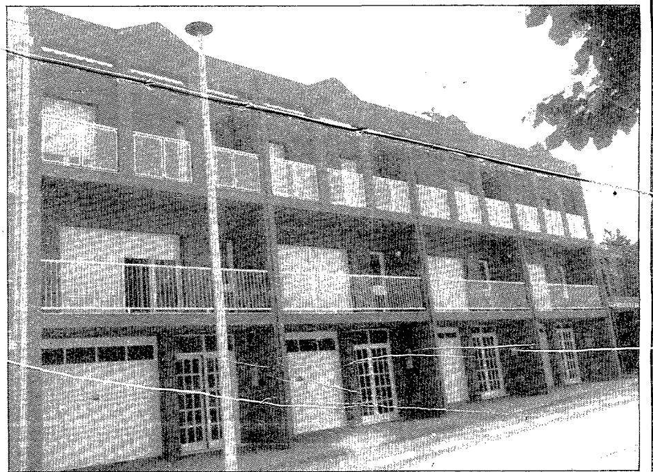
CALDES DE MALAVELLA