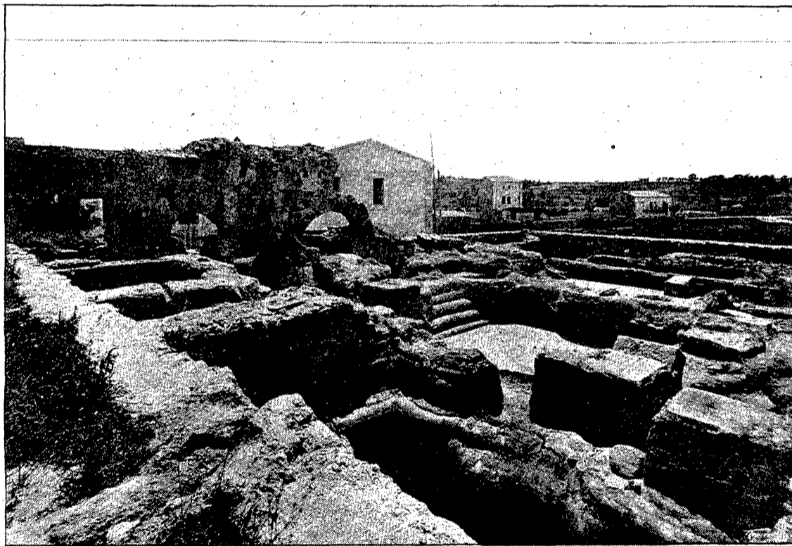
Les termes romanes de Sant Grau poc després de ser descobertes a principis del segle XX.