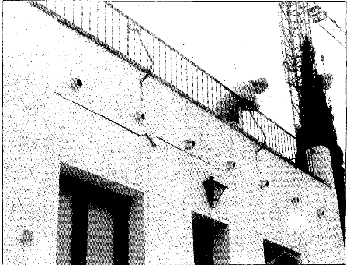
A la foto es pot apreciar l'esquerda que presentava la façana de la casa després de l'explosió.

Dirk Kramer, Rudy Fisher, Annette Steitz i Sabine Gortz esta-