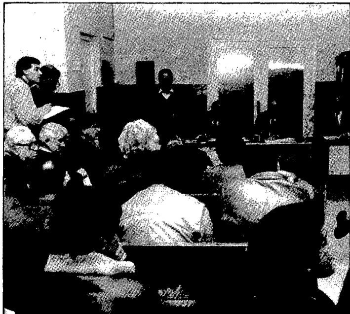
Els primers bancs són per als professionals.

101.000 pessetes. Els rècords històrics que recorden els treballadors de la duana no superen els tres milions que en algun cas s'han arribat a pagar per un esportiu. «Al senyor que no sàpiga guarda la compostura l'acompanyarem fins al carrer!», crida el guardia civil de servei quan els licitadors amenacen de passar dels crits a les mans. «L'únic secret —revela un dels gats vells que no se'n perden ni una— és conèixer el material que es posa a la venda i saber si realment és una ocasió. Llavors sí que te la pots jugar». El comprador que s'adjudica un vehicle ha de dipositar com a fiança un vint per cent del que li costa i en un termini de vint dies ha de passar a recollir-lo i abonar la resta que ha emparaulat. Durant deu dies, l'interessat té temps d'examinar la mercaderia que queda exposada en varis parcs repartits per tot Girona, però si vol tenir informació global de tot el que es ven a l'estat ha d'estar pendent del BOE.