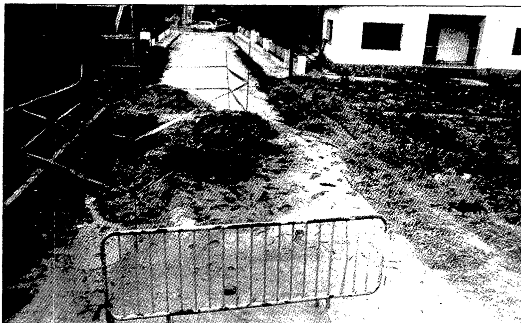
Les restes del sepulcre romà es troben soterrades al bell mig del carrer de Sant Esteve. El forat es féu volent arranjar una avaria que hi havia en la conducció de l'aigua potable.

BARCELONA. — El Jurat designat per atorgar el premi de sardanes «Sociedad General de Autores de España, S.G.A.E.-86» ha donat com a guanyadora la sardana que porta per títol «Tardorena», que fou presentada sota el lema «Capvespre» i és obra de Xavier Bollart i Ponsa. Van quedar finalistes del premi les sardanes «Oratjoll» i «La cançó de l'Albera».