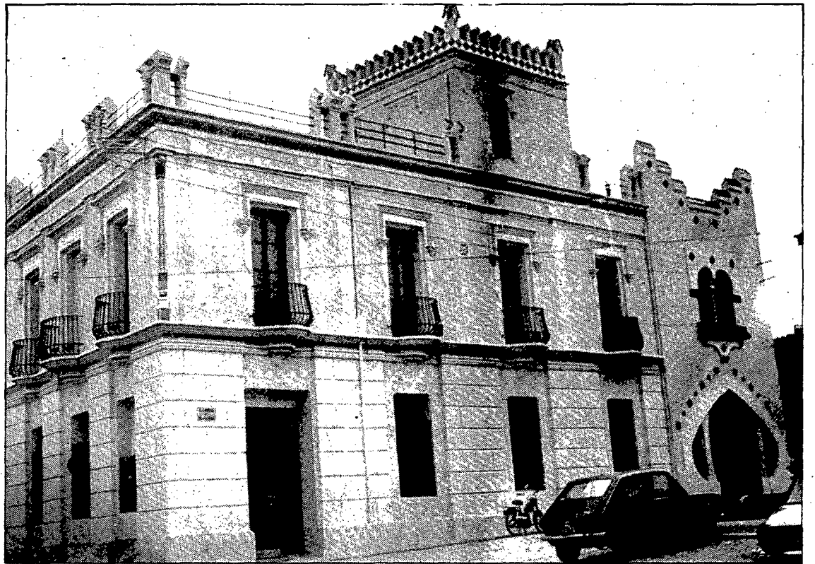
La Casa Rosa ha vingut fent fins ara les funcions de consultori i de biblioteca popular de Caldes.

Els arxius històrics de Caldes de Malavella seran a més classificats i preservats a la nova biblioteca. D'aquesta manera l'ar-