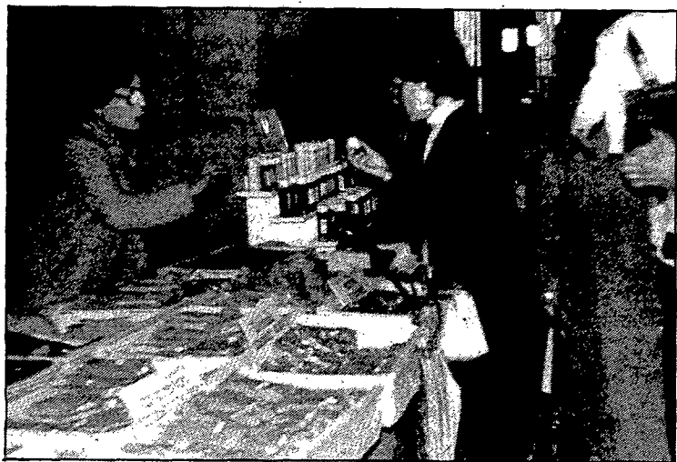
Cloenda de la ratafia. — La gran participació va ser el principal element de la III Festa de la ratafia que es va celebrar aquest cap de setmana a Santa Coloma de Farners. Una vegada més, en un ambient festiu, els aimants de la ratafia es varen reunir per desenvolupar tot un seguit d'activitats sobre el tema.