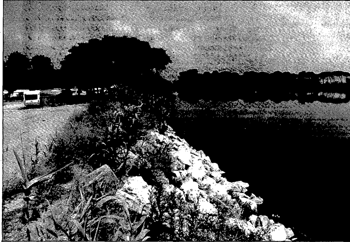
L'ajuntament ha presentat querella contra les empreses que contaminen el Tordera.