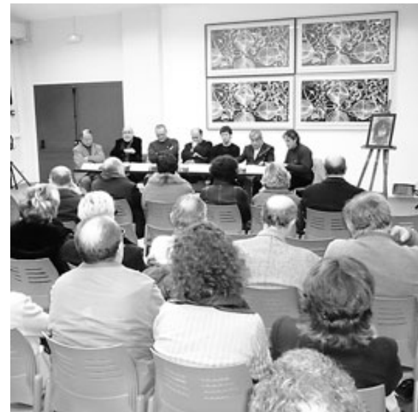
Un moment de la presentació de la revista, ahir a la nit.

Però també hi ha articles dedicats al patrimoni de la comarca, concretament del monestir de Sant Miquel de Cruïlles i de la torre dels Moscats de Torroella de Montgrí, sense oblidar la reforma del Terra-