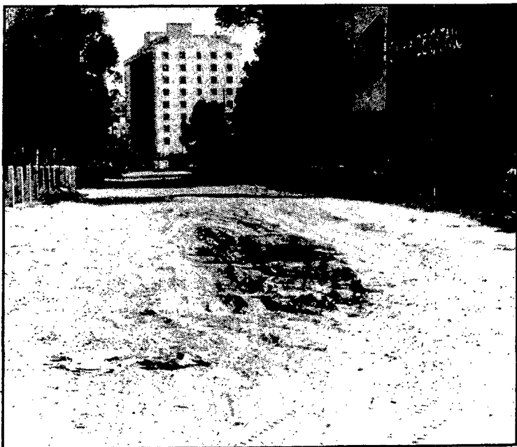
A l'urbanització Santa Margarida de Roses hi va haver un tiroteig entre la policia i la «banda dels quatre».

L'àrea d'acció. — En el mapa estan senyalades totes les poblacions on s'han pogut detectar robatoris i atracaments de la «banda dels quatre». Com es pot veure, l'àrea d'acció de la banda és molt ampla i abasta més d'una comarca. Veiem que els principals afectats pels atracaments són els pobles de la Costa Brava: Platja d'Aro, l'Escala, Sant Pere Pescador i Roses; o els pobles relativament propers a la costa, encara que darrerament se'ls ha vist més cap a l'interior.