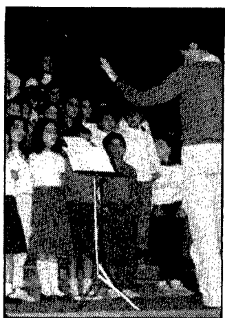
Un moment de la Trobada coral infantil a Sant Hilari. (Foto: Amadeo Duran).