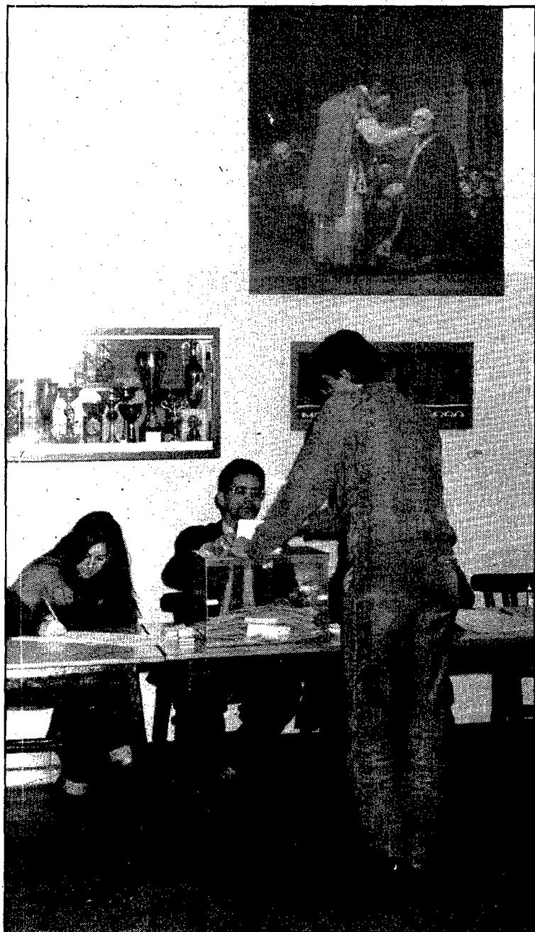
Situacions insòlites. — Tot es tracta del mateix: introduir el vot a l'urna. El que passa és que uns introdueixen el vot per la permanència o sortida de l'OTAN, com fa el ciutadà de Calella que recull la foto, i d'altres fan complir el vot de santetat tot introduint la Santa Partícula a la boca del beat que apareix a la pintura que presidia el col·legi electoral calellenc. La situació no hi ha dubte que és insòlita