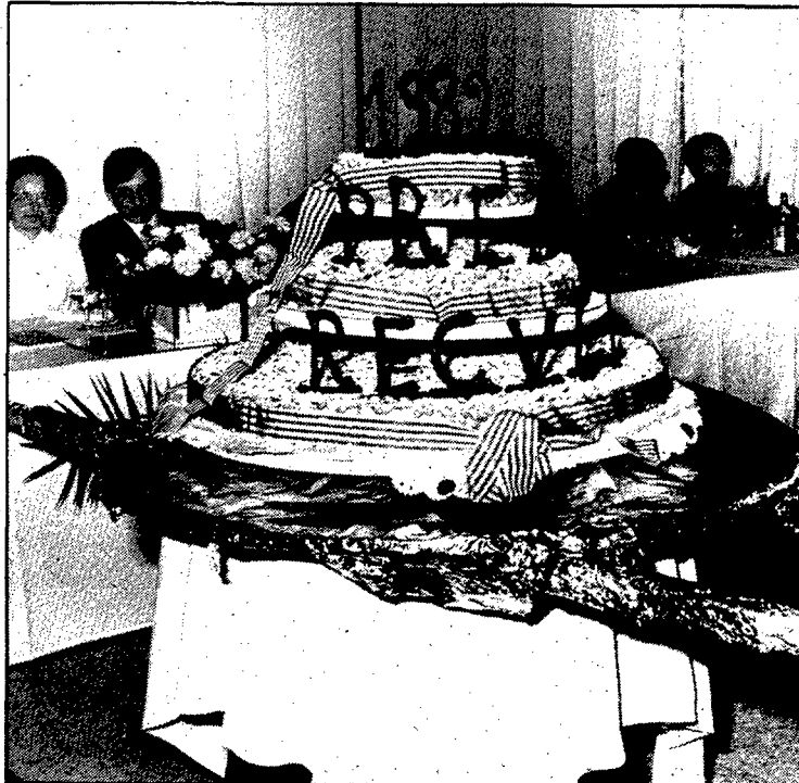
La festa literària dels premis Recull arribarà el diumenge dia 16 a la XXII edició.