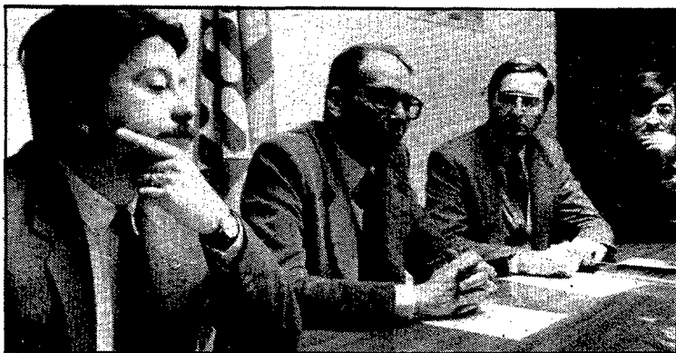
La coalició va trencar ahir el silenci.

Per als populars gironins aquesta postura no és antidemocràtica perquè «el que sí que ha