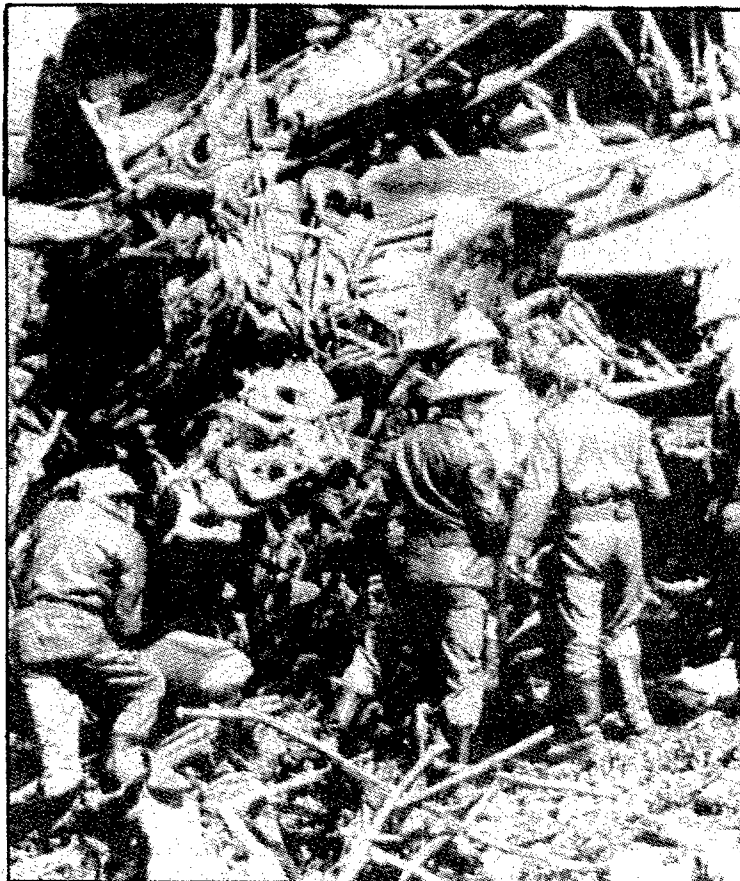
Les víctimes de l'accident de tren s'eleva a trenta-cinc,

El tren ràpid París-Rodez, que normalment s'havia de creuar amb el tren que va de Rodez a Brive a l'estació d'Assier, portava uns minuts de retard que va-