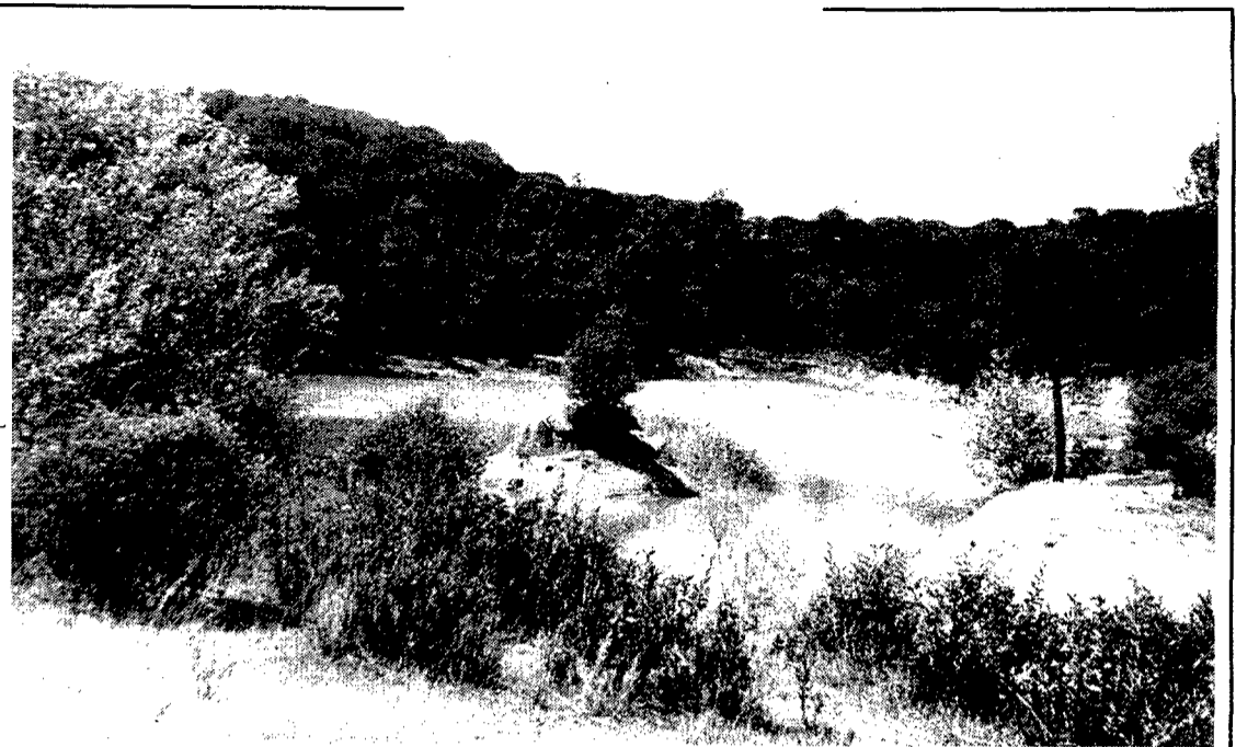
L'increment en la contribució servirà per crear depuradores

Encara és poca la gent que contempla aquests indrets com un lloc ideal per gaudir d'unes vacances tranquil·les, a prop dels centres d'esbarjo més famosos però lluny del seu atabament. En aquest sentit cal una tasca de promoció cap a la gent jove, alhora que es facilita, a les poblacions que els acullen, la possibilitat d'oferir-los uns equipaments que satisfacin les seves necessitats.