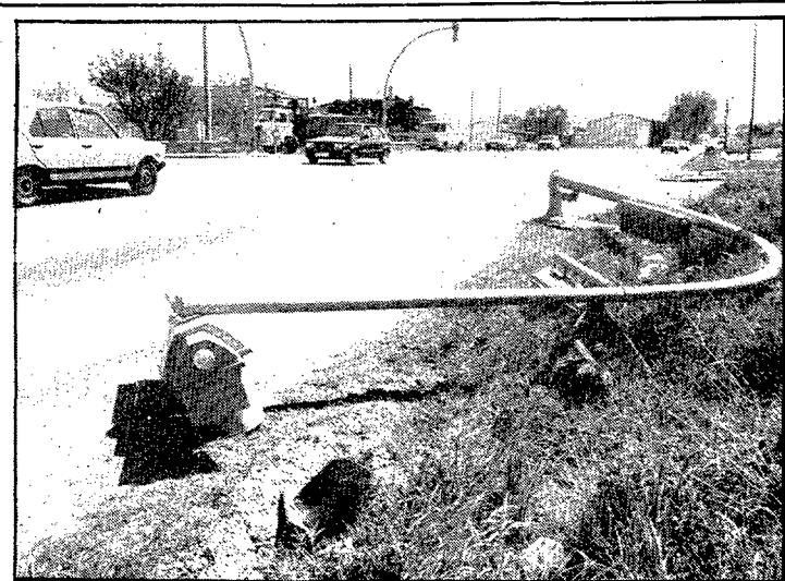
El vent s'emporta el semàfor.— Una ventada que va bufar una mica més forta del normal, va fer caure abans d'hir a primera hora de la tarda a la cruïlla d'accés a Palafrugell amb la carretera de Girona a Palamós, un dels semàfors que hi ha instal·lats. El semàfor, amb dotze llums, es va partir una mica més amunt de la seva base i va tallar durant uns minuts el trànsit pel carril fins que es va poder desallotjar la carretera.