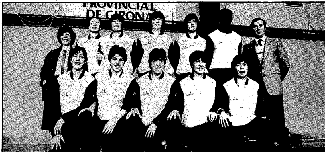
Trobar un patrocinador va ser fonamental perquè l'Adepaf es mantingués a la primera divisió.