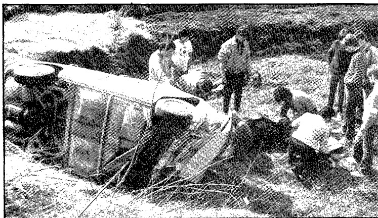
Prop de Vidreres es va produir aquest accident en què dues persones resultaren greument ferides, diumenge al matí.

L'altre accident motociclista amb víctima mortal es produí diumenge a tres quarts de dues de la tarda, a la carretera de Vidreres a Lloret, quan la motocicleta Benelli B-7955-DV, que