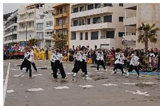
El temps va permetre celebrar la rua de l'Estartit. salvy mendoz

A l'Estartit, la pluja sí que va obligar a suspendre al migdia la sardinada popular que s'havia programat a la plaça del Port. No obstant això, a la tarda sí que va tenir lloc la rua de Carnaval.