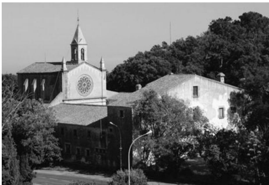
Vista de l'ermita de Sant Grau de Tossa en una imatge recent.

La idea de convertir Sant Grau en parador estatal no és nova. Durant el mandat