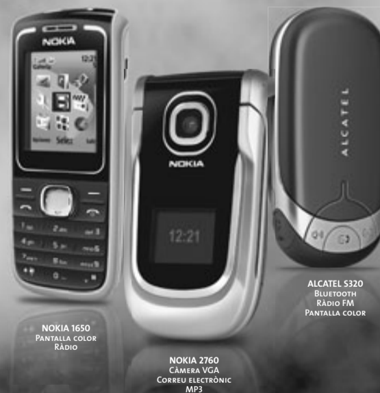
NOKIA 1650 PANTALLA COLOR RÀDIO