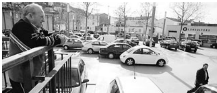
La plaça Frederic Rahola, on està previst fer un aparcament.