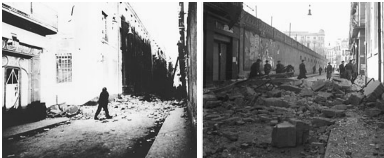
Imatges del carrer Nou de Girona al final de la Guerra Civil, el 4 de febrer de 1939. A l'esquerra, a la cruïlla del carrer Grober. A la dreta, amb la cruïlla de la Gran Via i la plaça Marquès de Camps al fons.

dien passar per aquell camí internacional més de tres homes armats de cop. L'ardit, malgrat tot, només va ajornar un dia el que era inevitable.