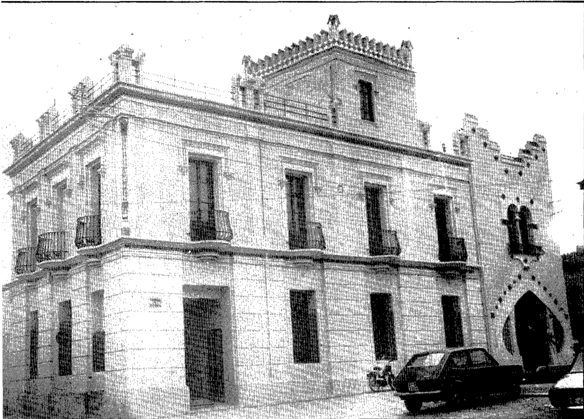
La Casa Rosa és propietat de l'Ajuntament, i per això les autoritats municipals no han cregut convenient d'adquirir ara el cafè del Casino de Caldes.

va seria tornar a fer una nova societat. «És molt difícil, ja hi ha massa coses per pagar entre tots!». Arribem a la Casa Rosa: «S'hauria d'aclarir per a qui és la