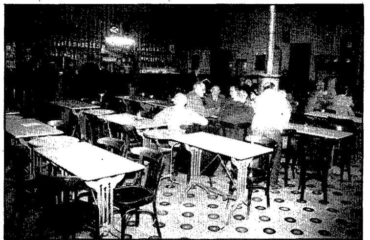
Una imatge que difícilment pot tornar-se a repetir. Les taules de marbre, l'àmplia sala i els tapets per jugar a cartes al Casino de Caldes de Malavella.