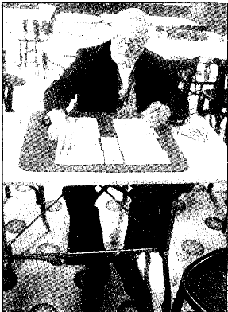
El Casino, lloc habitual de trobada dels jubilats que hi passaven llargues hores jugant a cartes.

Com va ésser que s'hagués de vendre la societat? «Doncs que els principals accionistes van voler recuperar els calés i se'l van vendre...», i no aconseguim treure més conclusions sobre la fi del «Casino Caldense», però continuem parlant del present i del futur del local. «Comprenem molt bé que en Colls ho vulgui vendre, ja que això del cinema està acabat i un llogater a la consergeria no li dóna per res». Una altra alternati-