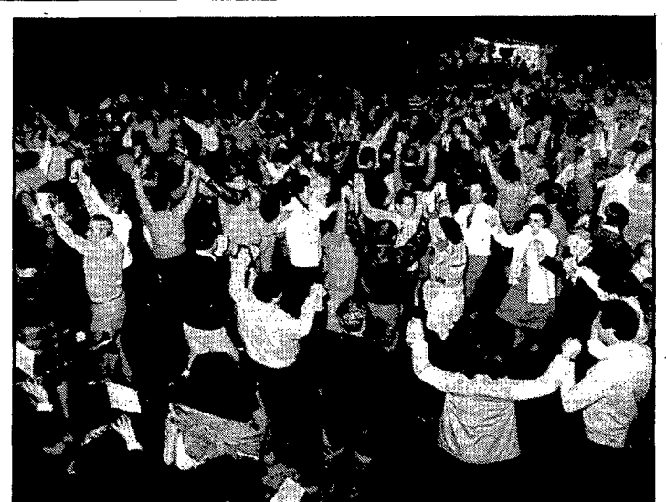
ESTANYOL, UNA FESTA COM MAI. — Amb una gran botifarrada es va donar per acabada la Festa Major d'Estanyol. Una festa com mai no s'havia vist, tant per la seva concurrència com pel seu programa atapeït d'actes per a tots, grans i petits. Els mateixos organitzadors se'n feien creus: «Mai una audició de sardanes, no havia aplegat tanta gent al poble». La plaça Josep Fontbernat va quedar literalment petita.