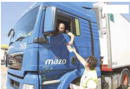
Fullets per als camioners que hauran de circular per l'AP-7

La Nacional II entre l'enllaç de la C-32, a Tordera, i el començament de l'autovia A-2 a Caldes de Malavella és el segon tram de l'Estat amb més costos d'accidentalitat per quilòmetre. A més, es tracta d'una carretera que reuneix sis –cinc a Girona– dels 13 punts negres de Catalunya amb alt cost per la sinistralitat fins a superar els 900.000 euros per quilòmetre.