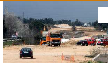
Foment repren les obres a la N-II