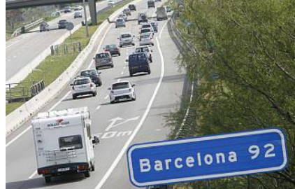
L'AP-7 va experimentar trànsit dens, però poques retencions. aniol resclosa

Les carreteres gironines van viure ahir una jornada marcada per la tranquil·litat, tot i ser el dia punta de l'operació de retorn després de les vacances de Setmana Santa. El mal temps havia anticipat que ja molts visitants marxessin cap a casa diumenge, i ahir els accessos més transitats als punts turístics de Girona, tant pel que fa a la costa com a la muntanya, van experimentar una circulació intensa, però les cues van ser circumstancials i no pas la tònica de la jornada.