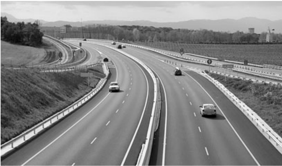
La C-35 entre Llagostera i Vidreres no presentava ahir complicacions viàries.