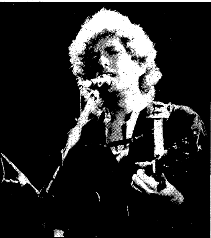
FOTOS DE RAFEL BOSCH. — El fotògraf gironí Rafel Bosch exposa aquesta primera quinzena de setembre una col·lecció de fotografies dels darrers recitals de Bob Dylan i Carles Santana a Barcelona. Les fotos penjen de les parets dels bars Freaks i Salsitxa de Girona. Bob Dylan (Foto: Rafel Bosch)

—No n'havia fet mai cap, però de seguida vaig veure clar que seria un interior de platja. El quadre consta d'una paret interior amb dues finestres als extrems per on es veu el mar. El terra està fet amb rajoles, però al damunt hi ha sorra de platja, com si hagués entrat per les finestres. En el centre, una cadira de platja amb una tovallola al damunt. I també l'horitzó que es veu a través de les finestres continua sobre la paret, però d'una manera més suau. Sembla que la platja estigui dins la casa.